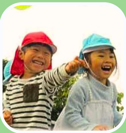
元気でよく遊ぶ子