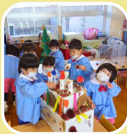
自分の思いを 表現できる子