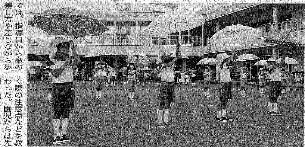
傘を差して歩く練習をした

型絵本などを使い、道路を通行する際には▽道路の右端を歩く▽交差点や横断歩道の手前では必ず止まり、左右前後の安全を確認する▽道路を渡る時は車が止まってくれたときか車が近づいてきていないときなどを心掛けるように伝えた。その上で「信号が赤かちかちと点滅し始めたから横断歩道は渡らない。横断歩道の真ん中で点滅したら焦らず、急ぎ足で渡り切つて」とアドバイスした。