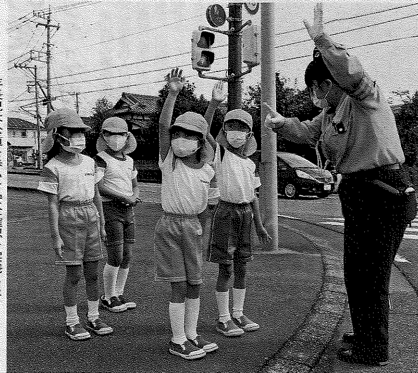
年長児は公道を歩いて安全確認を実践した