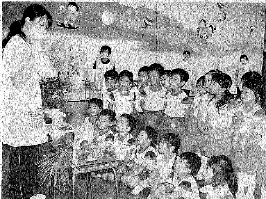
果物やススキなどのお供え物の説明を聞く園児