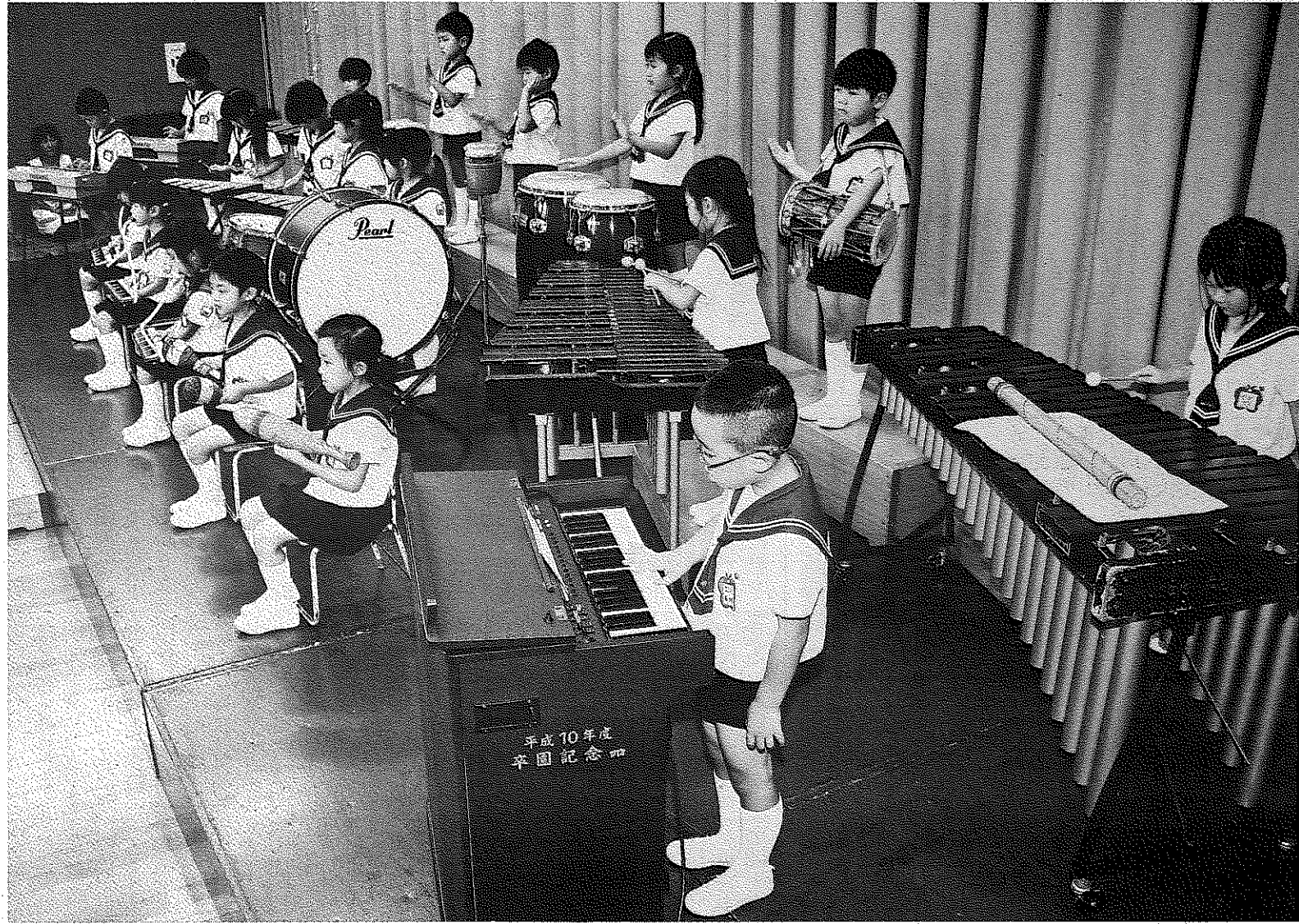
平成10年度 卒園記念