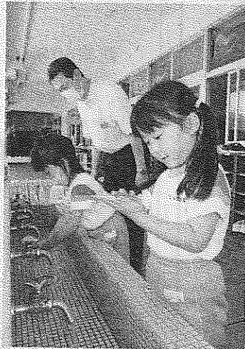
正しい手洗いを実践する年中児

いを記した短冊を笹に飾り各クラスにある 結んだほか、中北薬品 笹に装飾。自分たちで (株)社員を講師に手洗い 飾り付けし、華やかに の重要性を学んだ。 なった笹の葉に大きな 年少児から年長児ま 拍手を送り、七夕にち での189人は、「プ なんだ歌を元気な声で リンセスになれますよ 斉唱した。 ろに」「はしご車の運 手洗い勉強会には年 転手になれますよう 中児71人が出席。手洗 に」などと願いごを いの必要性を学習する 記した短冊と折り紙の 紙芝居を観賞したほ